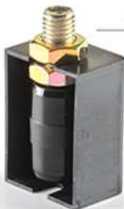
Art. CN 25 P