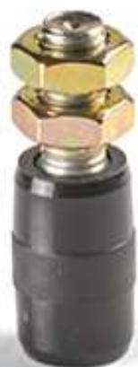
Art. CN 25